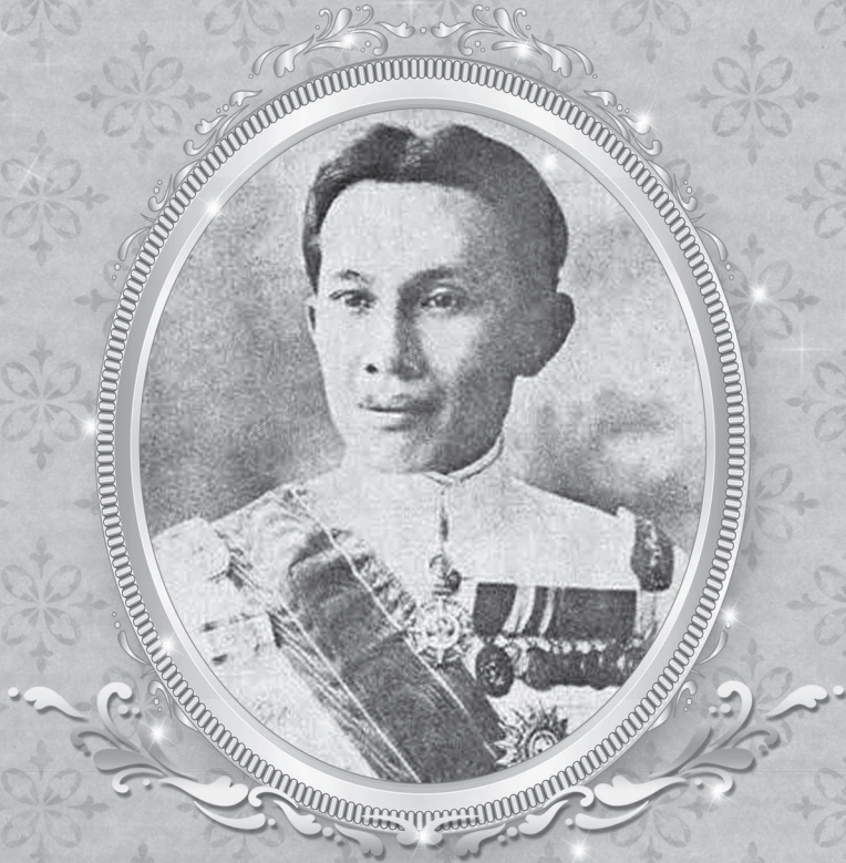
พระราชวงศ์เฮอ กรมหมื่นพิทยาลงกรณ์ พระบิดาแห่งการสหกรณ์ไทย